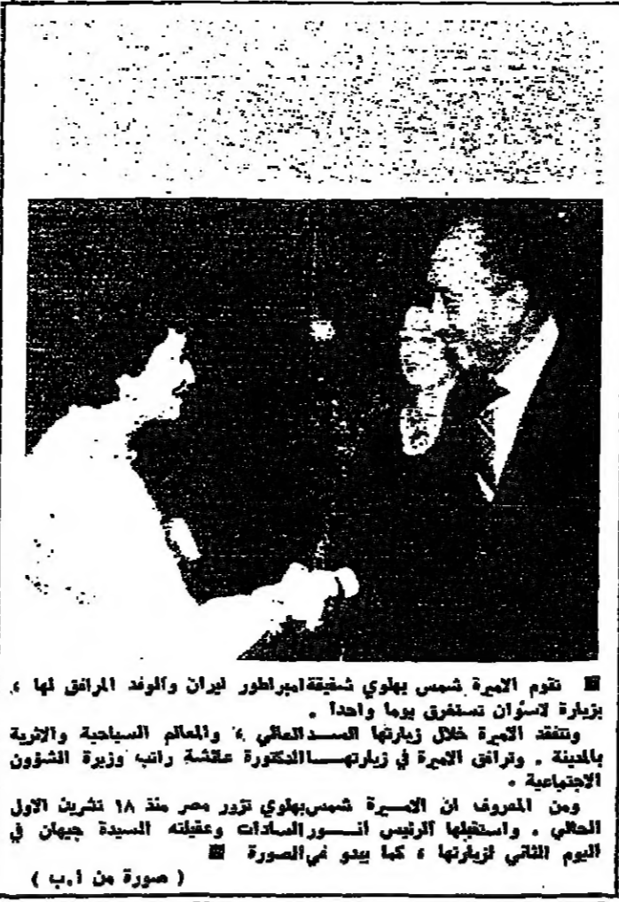
تقوم اللجنة شمس بهوي بزيارة لوزراء ايران والوند المرافق لها .

تنديد في الأردن بمحاولة اسرائيل اقامة حكم محلي بالضفة العربية القنصبي عتل : سنقاوم بكل الوسائل